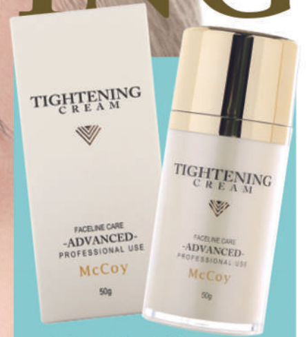
タイトンクリーム 50g

タイトンクリームは、鉱石で肌を引き上げ、 さらに塗り続けることでミネラルを整え、 エイジングケア3大要素のコラーゲン、 エラスチン、ヒアルロン酸を 効率的に増加させるサポートをします。